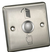
Бутон ASD BG Sbutton 2