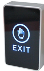
Безконтактен Бутон ASD BG Cbutton 8