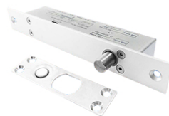
Електрическа брава тип болт за тесни врати ASD BG C-Lock 4