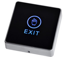
Безконтактен No-Touch Exit бутон ASD BG Cbutton 9