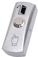
Бутон ASD BG Cbutton 5