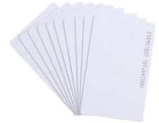
Карта EM 125 KHz тънка с номерация