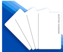
Безконтакта карта UHF RFID 860-960 MHz за четене от голямо разстояние