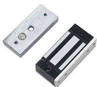
Брава ASD BG C-Lock 6 за стъклени врати